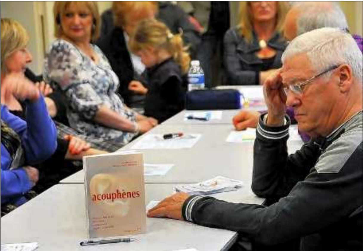
200 000 personnes sont diagnostiquées acouphéniques chaque année. Un handicap invisible avec lequel il faut apprendre à vivre.

Au programme : - dépistages gratuits avec présentation de matériel auditif, - présence de l'Association de réadaptation et de défense des devenus sourds et malentendants, - conférence-débat de 15h à 16h.