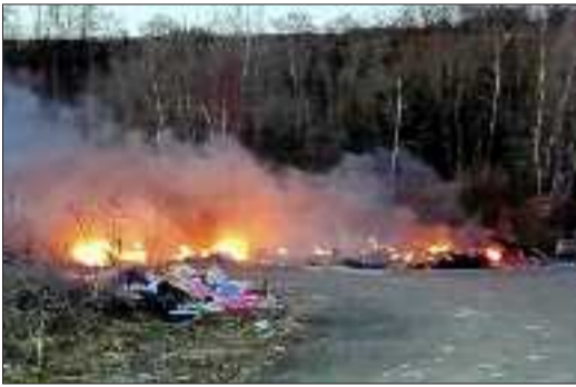
Pneus, matelas, jouets, sacs poubelle... ont encore été brûlés en pleine nature sur le site de Michévill.