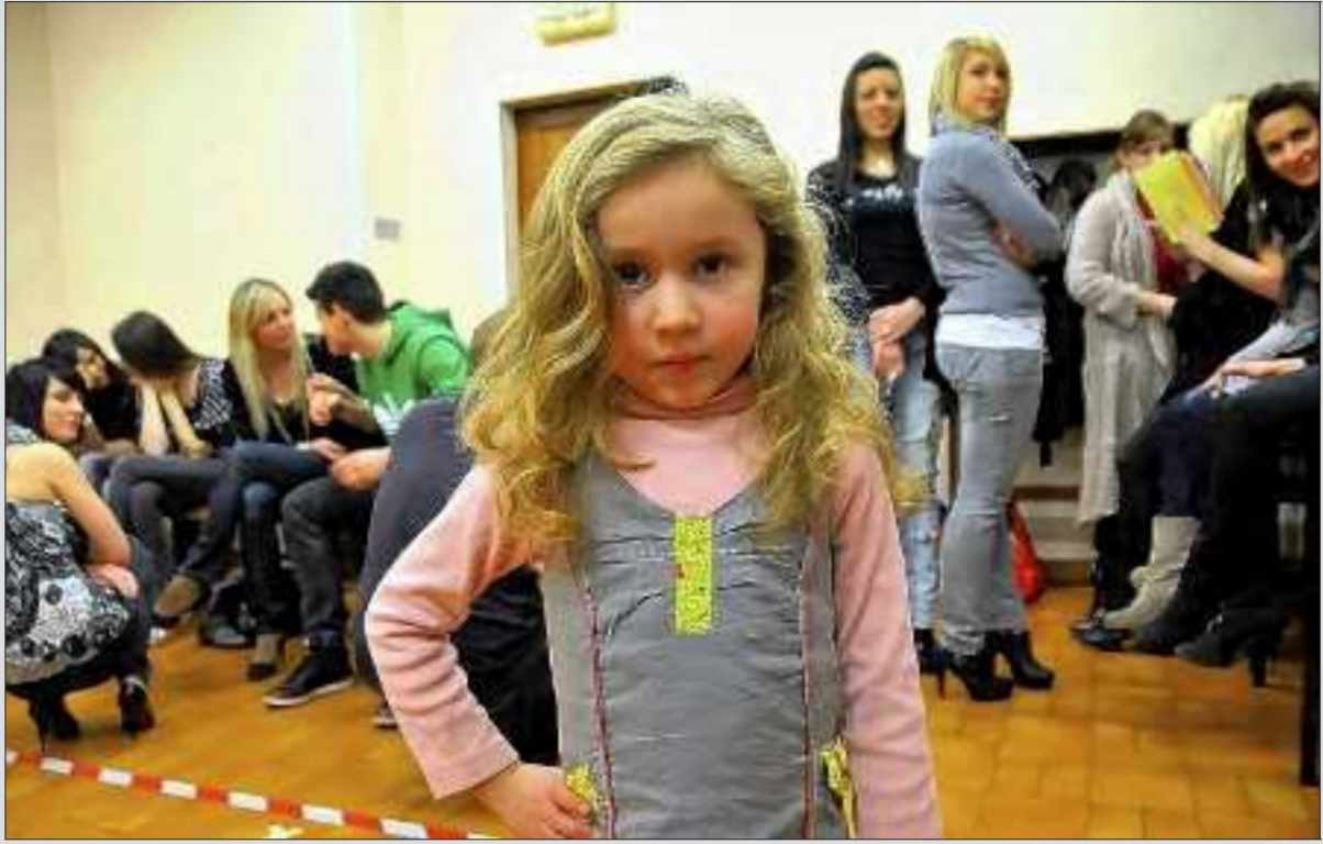
Ultimes répétitions. Ce n'est pas un simple défilé de mode qui se trame mais une grande soirée festive qui rassemblera cinq cents personnes. Qui dit mieux ?

De casting en répétition, le défilé a pris forme comme il