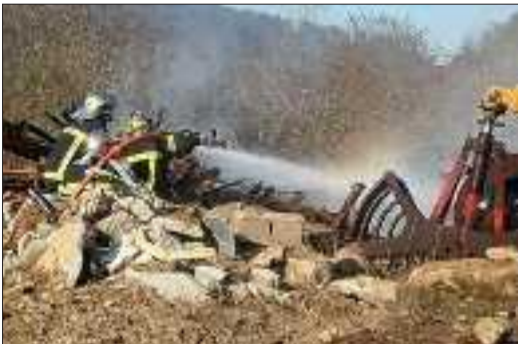
Les sapeurs-pompiers de Hayange et Nilvange ont rapidement maîtrisé le sinistre.