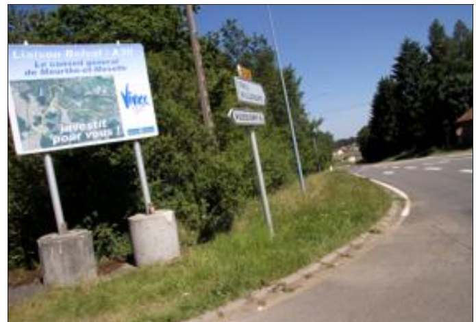
Les réactions des élus du Pays-Haut portent essentiellement sur la fin du tracé.