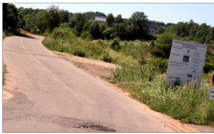
Pour l'association empreinte positive, le contournement va « détruire un corridor écologique supranational »

« Faire passer la route sur Micheville, c'est détruire un corridor écologique supranational reliant deux zones luxembourgeoises protégées, c'est mettre en péril de nombreuses espèces, c'est ruiner des milieux naturels rares. Les mesures de protection de la zone (classement en Espaces naturels sensibles, arrêtés de protection de biotope) et d'évaluation du corridor écologique a posteriori (c'est-à-dire après la construction de la route) ne sont