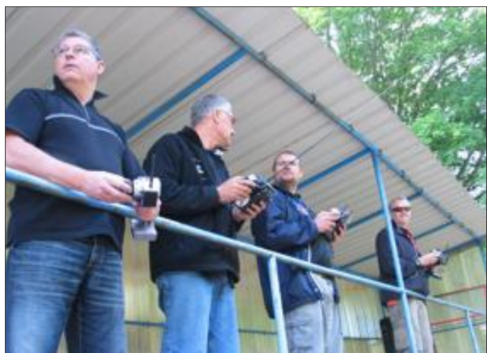
Une bien belle course organisée par l'Auto-modélisme.

Peu de monde concernant la participation de la course de ligue 6 Alsace/Lorraine.