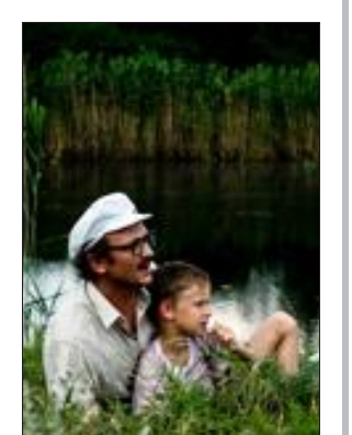
Terre outragée à La Scala.

CinéBelval BLANCHE NEIGE : vf, 17h40. CLOCLO : vf, 17h, 20h40 : 19h. LA COLÈRE DES TITANS : vf-3D, 18h. LES FAMEUX GARS : vf, 20h. En avant-première LES PIRATES ! BONS À RIEN, MAUVAIS EN TOUT : vf, 15h50. LES PIRATES ! BONS À RIEN, MAUVAIS EN TOUT : vf-3D, 14h. SUR LA PISTE DU MARSUPIAMI : vf, 14h, 16h, 18h, 20h. THE HUNGER GAMES : vf, 17h40. 7, avenue du Rock and Roll Esch-sur-Alzette-Luxembourg. Tél. 00 352 57 57 58.