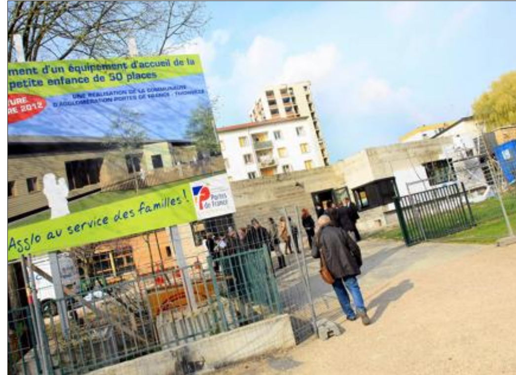
Le multi-accueil Les Petits de la Colline est en construction à Thionville, à la Côte-des-Roses. Il devrait accueillir cinquante enfants dès le mois de septembre.