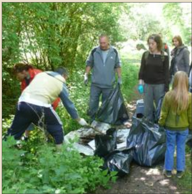
Entre Russange et Rédange, les membres de l'association Empreinte positive ont fait à nouveau une récolte peu enviable de déchets de toutes sortes.

Les forces de l'ordre et l'Office national de la chasse et de la faune sauvage ont répété dimanche, sur le site de Micheville, leur opération de contrôle vis-à-vis de ceux qui, conducteurs de quads ou de motos, utilisent les friches industrielles comme circuit d'évolution. L'ONCFS promet d'accroître ces opérations, qui viseront également tous ceux qui continuent à polluer cet espace protégé en y déversant des ordures de toutes sortes. De quoi mettre du baume au cœur des membres de l'association Empreinte positive qui, dimanche, à proximité, nettoyaient pour la énième fois un coin de nature sali sans scrupules.