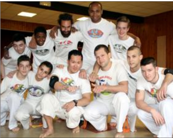
Depuis quatre ans, des cours de capoeira sont assurés à Thionville.

Sport, art & fun et Abada capoeira organisent à Thionville, du 18 au 20 mai, le premier festival de capoeira. Entre démonstrations, passage de cordes et cours de danses latines, la manifestation sera placée sous les couleurs et les rythmes du Brésil, en particulier samedi dès 16 h dans le centre-ville de Thionville. Objectif : faire connaître la capoeira, un sport très physique mais convivial qui se pratique dès l'âge de 4 ans.