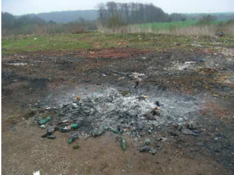
Photo 2: Restes d'incinération déversés en bord de route à proximité des entreprises ■ et ■

Photo 1: traces d'incinération de déchets à l'air libre à proximité du site des entreprises ■ et ■ implantées sur les hauteurs d'Audun-le-Tiche en direction d'Aumetz. Dans les cendres apparaissent des bouteilles en verre, des objets métalliques et plastiques.