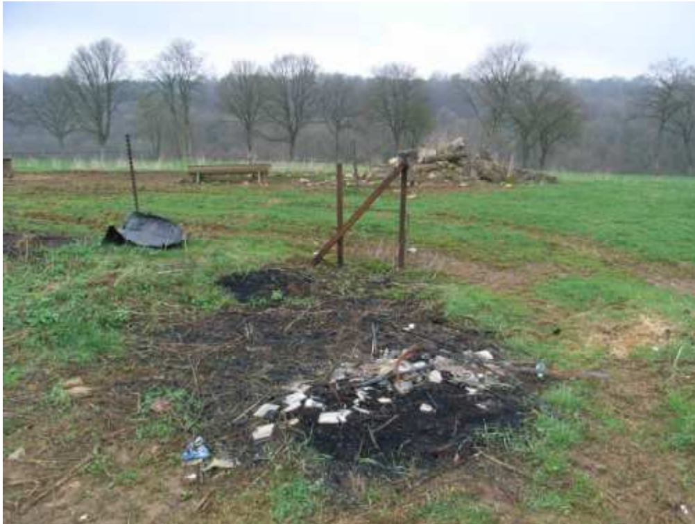
Photo 3: Traces d'incinération à proximité des entreprises [REDACTED] et [REDACTED] (photo prise à quelques mètres de la photos 2). Dans les cendres apparaissent des objets métalliques et plastiques.