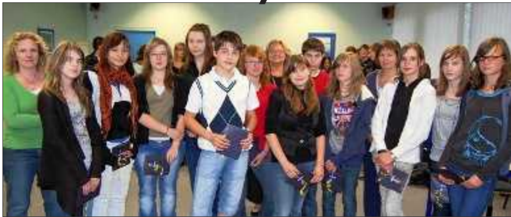
Les lauréats du défi lecture ont été récompensés par des bons d'achat.