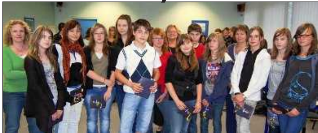
Les lauréats du défi lecture ont été récompensés par des bons d'achat.