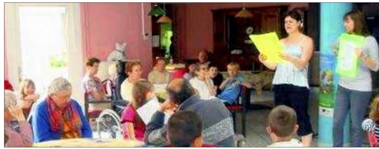
Elèves et pensionnaires de vrais instants complètes.

Cette sympathique matinée s'est achevée en chansons et dans une chaleureuse ambiance.