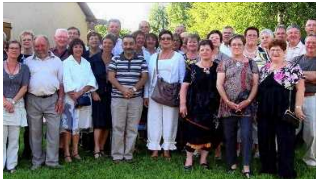
Trente-six nouveaux sexagénaires venus de toute la France avaient fait le déplacement.

Avant de se quitter, ils se sont promis de se revoir prochainement, peut-être dans cinq ans.