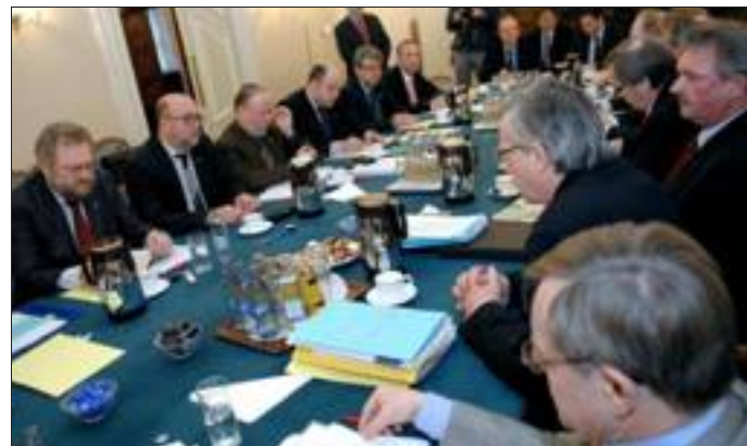
Responsables gouvernementaux, patronaux et syndicaux qui composent la Tripartite se retrouvent aujourd'hui...

On savait le "modèle luxembourgeois" gravement menacé d'explosion en raison de la crise mondiale. Les premiers tours de table de la Tripartite confirment ces craintes au plus haut point : depuis quelques jours, tous les voyants sont passés au rouge... Communiqués syndicaux incendiaires, déclarations fracassantes d'un ministre se désolidarisant des propositions du gouvernement de coalition, réveil brutal de l'opposition, qui ne mâche pas ses mots sur la "vision à court terme" dudit gouvernement. Et pour couronner le tout, Jean-Claude Juncker, bloqué sur le plancher des (peaux de) vaches en raison du nuage volcanique islandais, a dû se taper Madrid-Luxembourg par la route pour présider hier un conseil gouvernemental de crise... Rien ne va plus, les Luxembourgeois sont inquiets, le pays est au bord de la crise de nerfs ! Certains frontaliers en profitent pour jeter sournoisement de l'huile sur le feu, appelant à "une grève générale à la française" dans les forums de discussion.